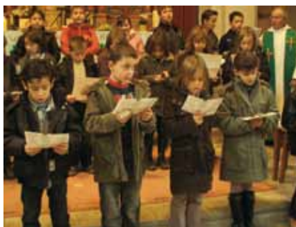
NOTRE DAME DE BASSE TARENTEISE

Autour des membres de l'EAP (qui se réunissent chaque mois sous la présidence du prêtre) se sont constitués différents groupes : la catéchèse pour environ 35 enfants, des animateurs liturgiques afin de préparer les messes de chaque dimanche, à tour de rôle, des équipes