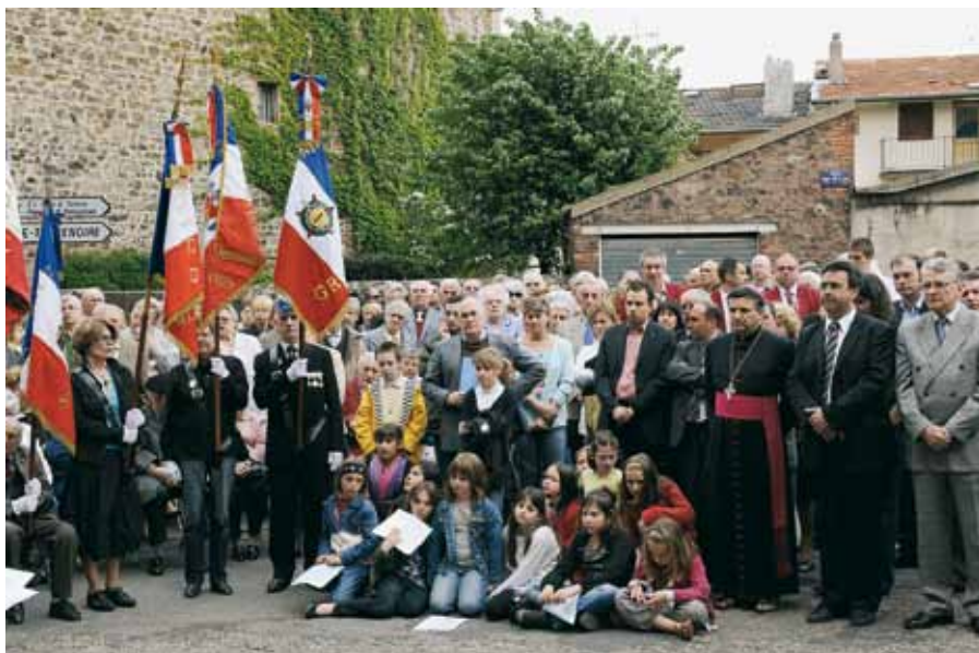
On devient résistant en apprenant des générations passées ce qui est destructeur pour l'homme.