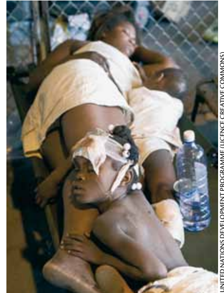
Une jeune fille haïtienne dort avec sa mère et son frère.

dessous errant, sans savoir où aller - ceux qui perdent la tête sont nombreux... Face à tout cela, mon Dieu, que veux-tu ? Je sais jusque dans mes entrailles que tu es le Dieu qui nous aime, nous crée, nous sauve. Je sais que tu n'as aucune feinte et magouille en toi. Tu es le Dieu de la bonté et de la miséricorde. Tu es un mystère. Ta grâce aussi est un mystère. Mais le mal n'est-il pas un mystère également ? Je ne cherche pas à comprendre ce mal mortel qui nous tombe dessus brusquement, mais nous savons que le mal n'a pas le dernier mot : l'amour croit tout, comprend tout, accepte tout. Jésus, ton fils nous disait : courage j'ai vaincu le monde. Merci mon Dieu pour ce que tu es. Nous t'aimons comme tu nous aimes. Nos vies et nos esprits sont entre tes mains. »