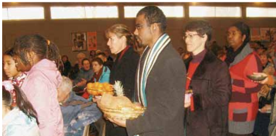
Debout nous voulons vivre debout.

U ne tradition déjà bien ancrée sur Albertville veut qu'un dimanche de janvier, des gens venus des quatre coins du monde et résidant chez nous occupent le devant de la scène à la messe. Il faut préciser qu'au niveau de l'Église catholique, dans le monde entier, en ce 3 e dimanche de janvier, la pensée, la prière et l'action sont branchés sur les migrants et les réfugiés. Ce dimanche 17 janvier, après l'accueil-café puis un échange en petits groupes pour mieux comprendre les problèmes de migrations, ils ont donné de suite le ton de la célébration en venant en cortège planter chacun sa fleur sur la carte du monde, à l'emplacement de son pays. Cortège joyeux et coloré... cortège sérieux et engagé, rythmé par le chant : « debout nous voulons vivre debout avec tous ceux qui ne peuvent plus marcher, ceux qui n'ont plus rien à espérer ». On pensait bien sûr aux gens d'Haïti et à la solidarité qu'ils attendent de nous. Mais on avait aussi en tête ceux qui vivent l'immigration chez nous comme un drame : sans papiers,