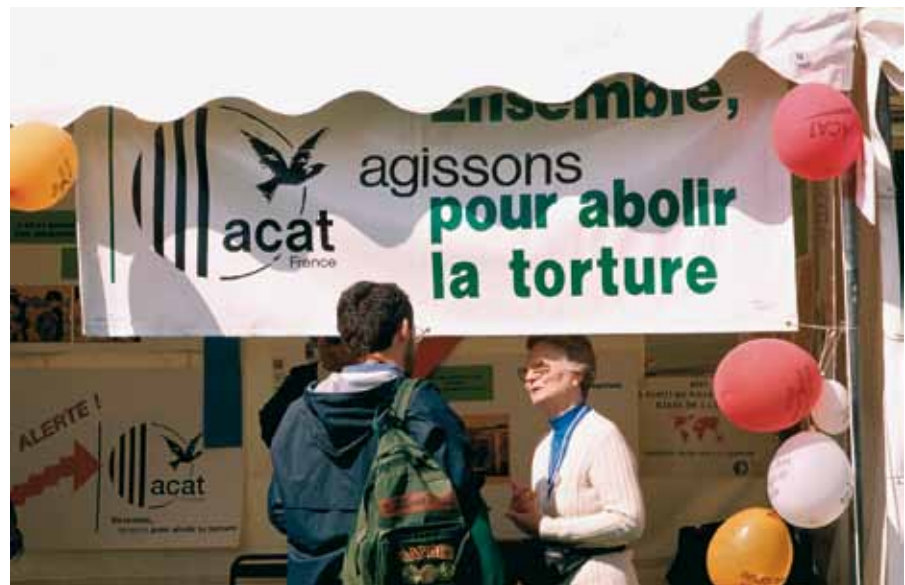
La longue histoire des droits de l'homme continue de se vivre aujourd'hui à travers des mouvements comme l'Acat.

Si vous voulez en savoir plus : www.acatfrance.fr