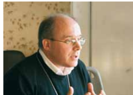
C'est l'évêque qui confie la mission aux LME !

Le concile Vatican II ( Lumen gentium nos 31-33) nous rappelle que le service dans l'Église « concerne tous les chrétiens sans exception » Il poursuit affirmant que « les laïcs peuvent, de diverses manières, être appelés à coopérer plus immédiatement avec les prêtres et évêques... » Mais le contexte évolue... chacun se rend compte de l'évidente pénurie de prêtres. Plusieurs milliers de laïcs en France, quelque soixante-dix dans nos diocèses de Savoie, dont une majorité de femmes, reçoivent mission pour exercer de manière permanente animations, organisations, et fonctions spirituelles. Nombreux sont embauchés avec un contrat de travail. Les conditions d'emploi de ces permanents, des « intermittents » de l'Église, révèlent des fragilités : la mission limitée à quelques années, malgré l'existence d'un CDI, souvent