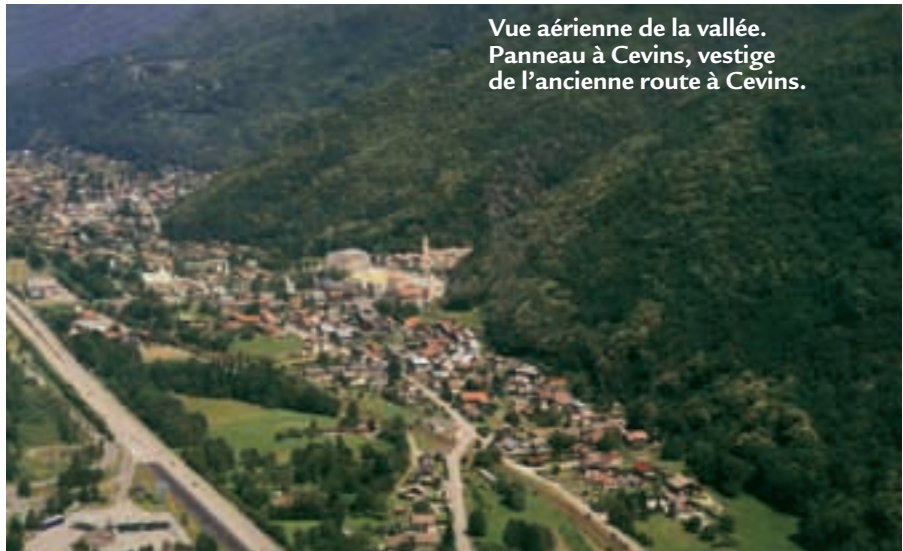
Vue aérienne de la vallée. Panneau à Cevins, vestige de l'ancienne route à Cevins.

L'Isère à cette époque est un torrent non dompté, et pour que les voyageurs gardent les pieds au sec, la route suit alors la limite supérieure de la plaine. Elle arrive à Saint-Sigismond (via Gilly), traverse l'Arly sur un pont disparu depuis, monte à Conflans, puis redescend dans la plaine. Suivant la plaine de Conflans, elle arrive à Tours, passe près du château, traverse tout le haut du village et rejoint « Chantemerle ». Toujours en suivant le bas de la montagne, elle arrive à Arbine, Langon, grimpe jusqu'au « col de la Creusaz ». Après avoir traversé La Montaz, Cevins,