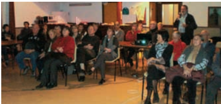
Une réunion-bilan sur la vie de la paroisse Saint-Roch en Beaufortain.

Il est vrai qu'en vingt ans, de gros changements sont intervenus et beaucoup peuvent se trouver déstabilisés. Pourtant, de bonnes surprises se sont dégagées du débat : la célébration des funérailles par des laïcs est bien acceptée et est même jugée souvent « plus chaleureuse », une moindre présence de prêtres implique un engagement plus fort des laïcs, une EAP (Equipe d'animation paroissiale) plus orga-