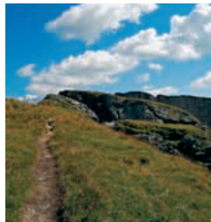
Chemin en Beaufortain.

Le chemin de la vie est souvent rocailleux, chaotique ; il faut prendre garde de ne pas tomber dans des ornières. Si le chemin est tortueux, il a mauvaise réputation : vous allez vous égarer, vous progresserez mal ; il ne faut pas non plus aller par quatre chemins : vous allez vous perdre faute de savoir décider à un carrefour de la vie.