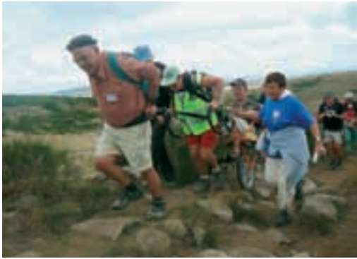
La joëlette : l'évolution moderne de la chaise à porteurs qui ouvre les sentiers de randonnée aux personnes handicapées motrices ou polyhandicapées...