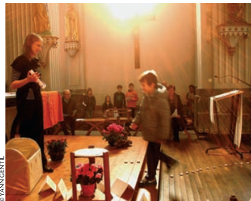
Au cours de la messe des familles !

Santé spirituelle : chaque dimanche de carême proposera une méditation sur chaque Évangile tramé sur le fil rouge :