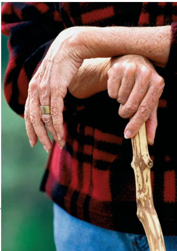
Dépendance : apprendre à s'appuyer sur... Confiance !

Eh oui « tout dépend », c'est selon les circonstances ! Ce sont bien les situations et la manière de vivre les dépendances que ce dossier « Vrai » veut envisager !