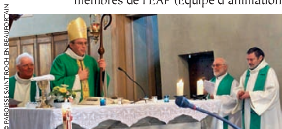
Concélébration de la messe dominicale dans l'église d'Hauteluce.