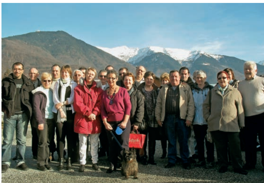
« Prévenir, agir, guérir ».