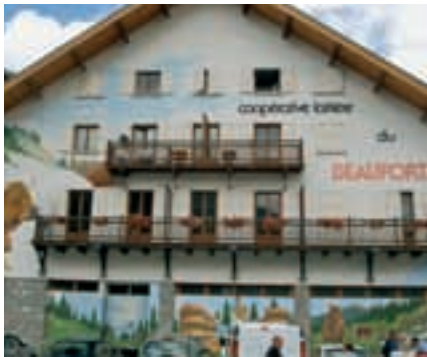
La visite de la coopérative est gratuite et attire des milliers de visiteurs.

C ette coopérative fut créée en 1961 à l'instigation de plusieurs producteurs de lait. Joseph Viallet en fut le fondateur. En 1968, le fromage de Beaufort devient une appellation d'origine contrôlée. Ce fait permet d'acheter le lait plus cher que dans d'autres régions et maintient l'élevage de montagne. Aujourd'hui, 115 exploitants du secteur fournissent, par an, 10 millions de litres de lait ce qui permet de faire 24 000 meules. La coopérative se visite, et environ 40 000 visiteurs se pressent pour voir la confection du fromage ou visiter les trois caves d'affinage, dans lesquelles le Beaufort reste 7 à 8 mois avant d'être vendu. Mais la coopérative ne fait pas que de la fabrication et de la vente. Par son activité, elle joue un rôle important dans l'économie de toute la région d'Arêches-Beaufort. Elle emploie des artisans locaux (électriciens, menuisiers, charpentiers, etc.) L'an passé, elle a réinjecté 9 millions d'euros dans la commune. En outre, elle emploie 31