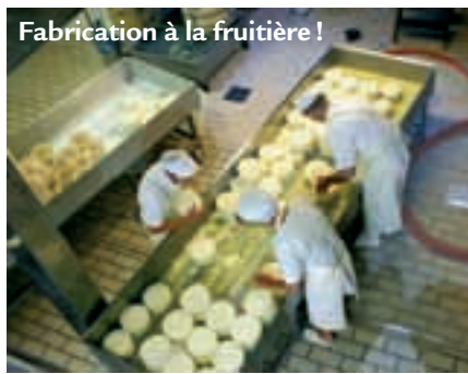
Fabrication à la fromagerie !

Vingt-deux jeunes du MRJC (Mouvement Rural de la Jeunesse Chrétienne) d'Alsace, du 12 au 23 juillet 2010 au camping municipal d'Albertville. 12 jours pour découvrir une autre région. Les jeunes, en autonomie pendant 24 heures, sont partis à pied à la rencontre d'exploitants agricoles, jusqu'à l'alpage des Drisons, au-dessus de Tamié, parlant, au passage avec les moines de Tamié, ou ont rejoint l'alpage de la Thuile, au-dessus de Notre Dame des Millières, ou encore ont rencontré un couple d'agriculteurs à Tournon. Ce fut pour eux l'occasion de connaître certains aspects de l'agriculture savoyarde.