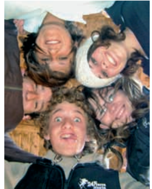
Rassemblement à Taizé avec nos copains, sur qui nous comptons pour nous donner des idées et des coups de main.