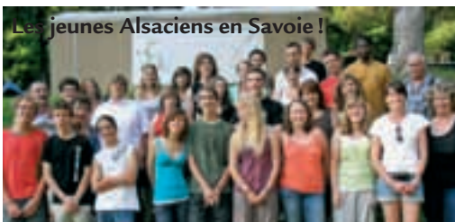
Les jeunes Alsaciens en Savoie !

Qui a dit qu'il n'y avait pas de jeunes dans les villages ? Ici, ils sont prêts à s'investir, à rester ou à revenir s'installer sur leur territoire rural. Alors, oui ça bouge dans nos campagnes.