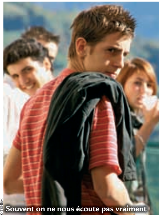
© TEHEM Souvent on ne nous écoute pas vraiment

« Moi je pense que le progrès c'est bien, ça produit plus, plus vite, plus gros, plus beau : c'est la science. Mais c'est vrai aussi que l'on n'en connaît pas tous les effets négatifs sur la santé ; il n'y a pas de recul. »