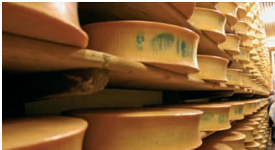
Les meules restent dans les caves pendant sept à huit mois.