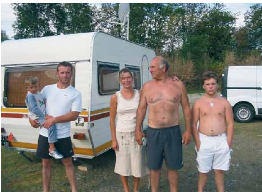
Hommes et femmes du voyage, à Sainte-Hélène en 2006.