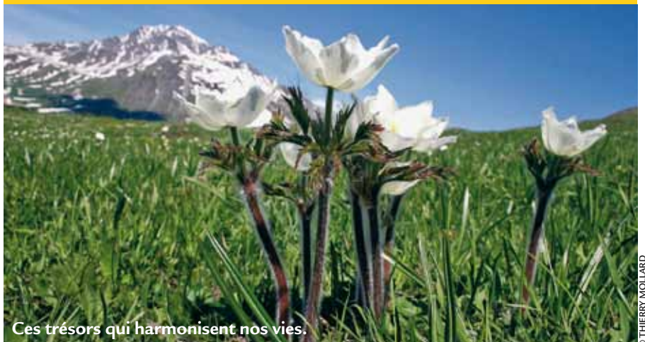
Ces trésors qui harmonisent nos vies.

Le rythme de nos vies s'appuie sur la récurrence des fêtes, anniversaires, journées ou années particulières : journée mondiale de la paix le 1 er janvier, de la femme, 8 mars, ou plus inattendues, journée mondiale du tricot (9 juin) sans oublier la journée mondiale du diabète (14 novembre) du fromage (24 mars) et de la santé le 7 avril.