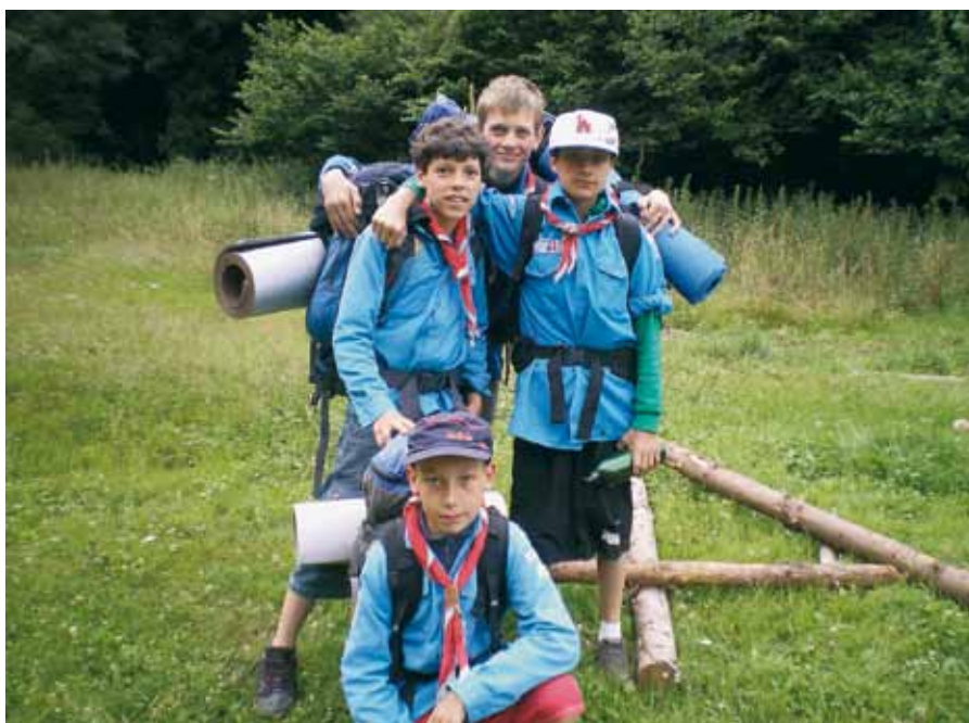
Patrouille des garçons prêts à partir en RAID.

Le mouvement des scouts et guides de France s'articule autour de plusieurs points qui sont les suivants : construire sa personnalité, éduquer des garçons et des filles, vivre ensemble, habiter autrement la planète. Pour 2009-2010, faute de chefs en nombre suffisant, seuls les scouts et guides (garçons et filles de 11 à 15 ans avec les chemises bleues) pourront mettre en œuvre ce projet.