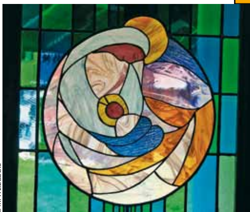
Notre Dame de Haute Lumière, Les Saisies.