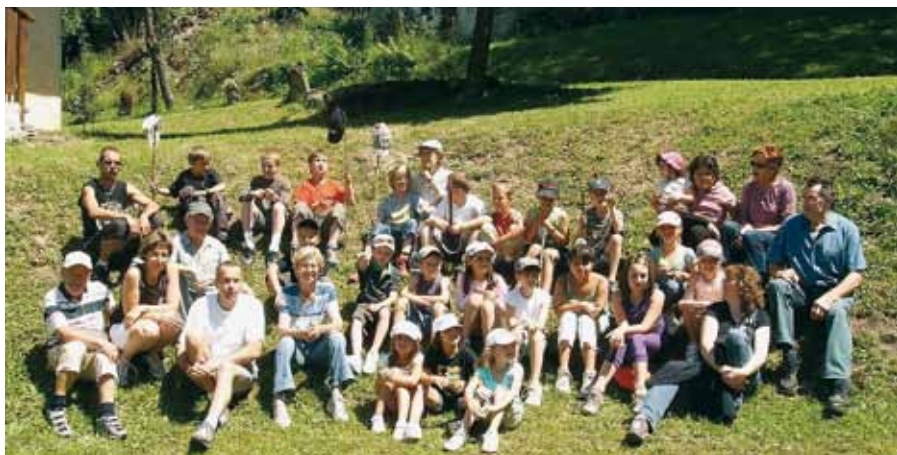
Aire de repos au bord du chemin !

Un recteur ou prêtre desservait la chapelle du village devenu pour un temps « Paroisse ».... Cette chapelle, dédiée à la Sainte Trinité, date de 1694, a perdu sa cloche et tombe doucement en ruines comme beaucoup de maisons dont on découvre derrière la végétation envahissante des murs ou des caves. Heureusement des familles maintiennent des chalets et une clairière au milieu de forêt.