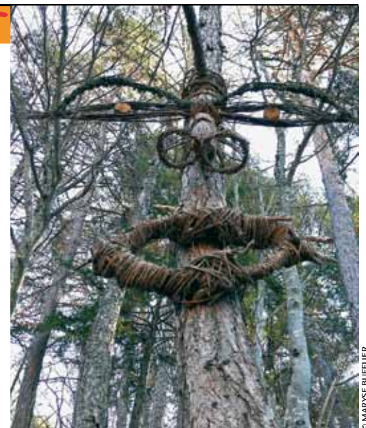
L'esprit de la forêt sur le sentier Lez'Arts.

nous permet la découverte d'œuvres contemporaines, réalisées cette année sur le thème : « Les cinq sens ». Ce sont certes des œuvres éphémères, mais qui montrent bien qu'on peut créer à partir de n'importe quel matériau. Le sentier artistique est une boucle de 4 km environ, praticable par tous et intéressant pour les enfants comme pour les adultes ; il est ouvert toute l'année et traverse cinq hameaux s'étagant de 800 à 1 350 mètres d'altitude. Il démarre d'un plan d'eau, idéal pour le pique-nique et même pour la pêche. Et vous, où êtes-vous allés ?