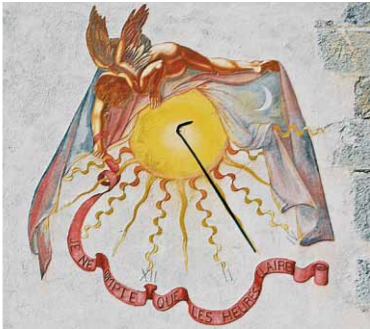
Cadran solaire à Marthod.