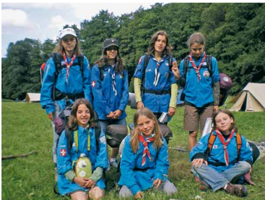
Patrouille des filles avant le départ en RAID.