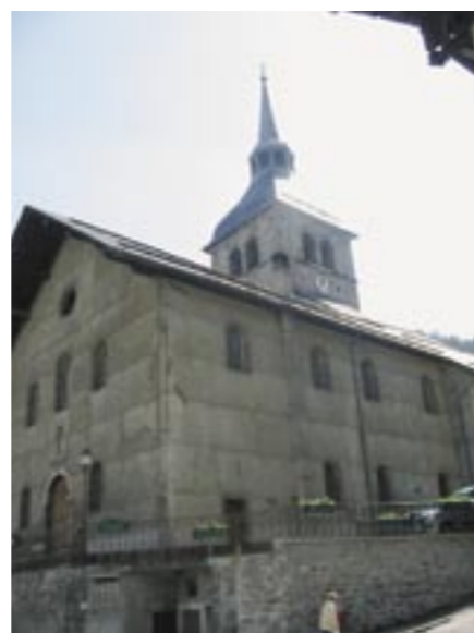
Eglise de Beaufort

> « Pentecôte 2008 » : une seule messe dans le Beaufortain célébrée à la chapelle des Saisies, suivie d'un temps festif et repas partagé.