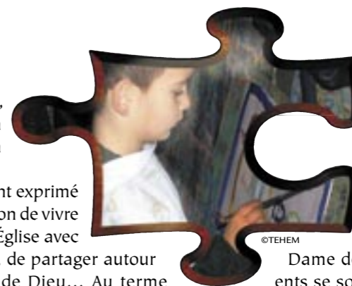
Parole de Dieu au bout du pinceau.

Au cours d'une réunion de parents en septembre 2008, les parents prirent conscience que, pour proposer « plus », ils devaient s'impliquer dans la catéchèse de leurs enfants. Cinq mamans et un papa acceptèrent de « faire le caté » tous les 15 jours, le samedi matin. Ces derniers prennent le temps de se former