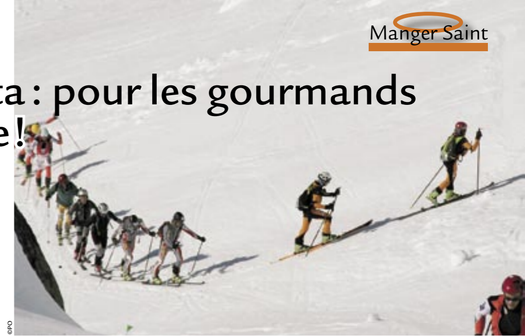
Pierra Menta jour après jour.

Pour accueillir tout ce monde il faut une sacrée organisation. Un bureau de dix personnes gère 300 bénévoles qui vont des contrôleurs aux pisteurs, en passant par les responsables de l'hébergement. Le départ et l'arrivée