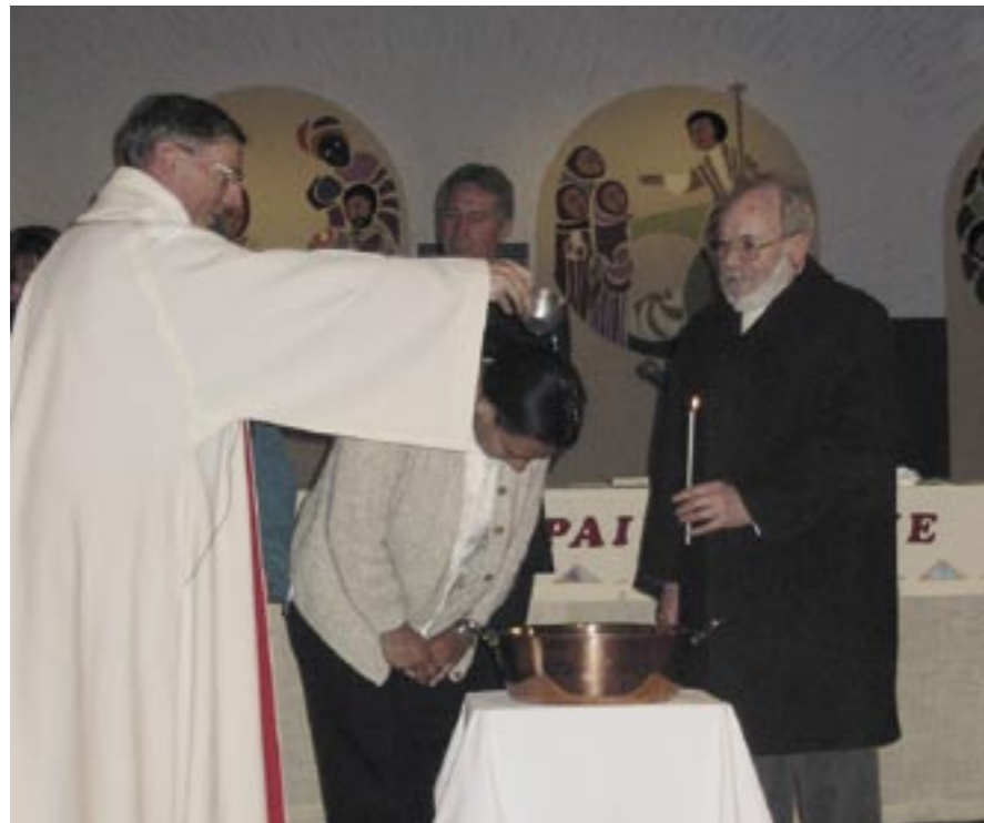
Baptême d'adulte à Sainte Thérèse d'Albertville à Pâque 2007.

Pour les catéchumènes le baptême est précédé de l'appel décisif par l'évêque, cérémonie fixée cette année au 1 er mars. C'est le moment où l'adulte demande officiellement le baptême.