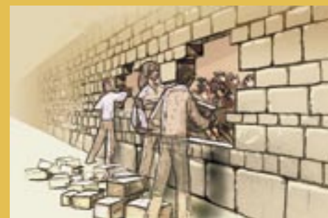
Faire émerger l'in vraisemblable