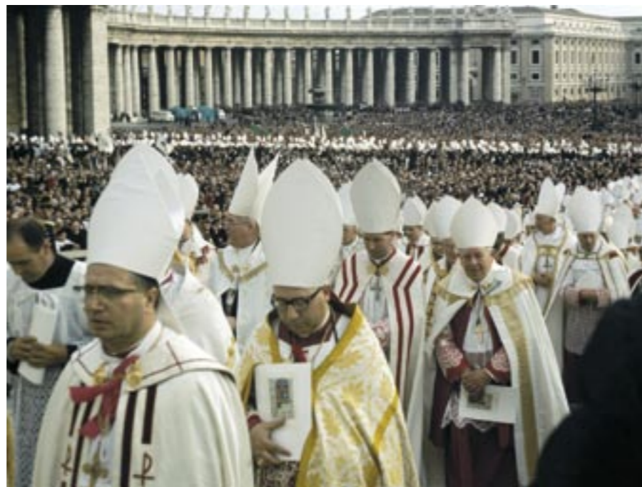
Il y a quarante ans, le concile Vatican II.

Ces orientations, pour nous, ne sont pas négociables. Pour les disciples de Mgr Lefebvre, ces orientations, pour